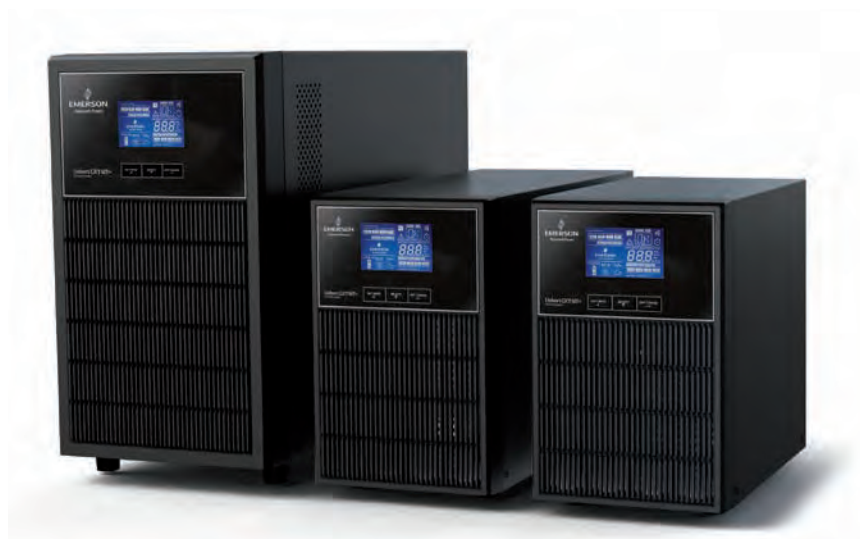
Liebert GXT MT+ 1 кВА — 3 кВА Gen. 2