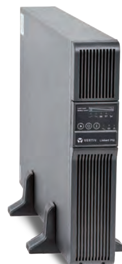
PSI 2U Вертикальная установка