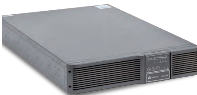
PSI 2U Стоечная установка