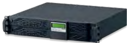
3 100 45