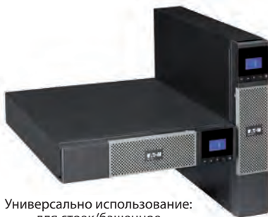
Универсально использование: для стоек/башенное