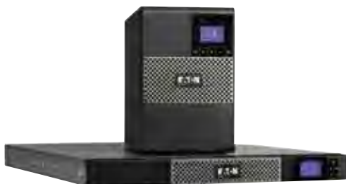
Исполнения Башня и Стойка 1U